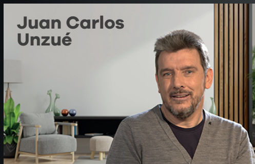
Juan Carlos Unzué

Profesional libre Conferenciante i Exfutbolista